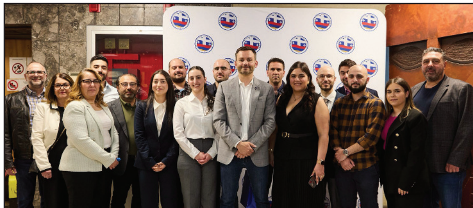
Կարդալ էջ 8