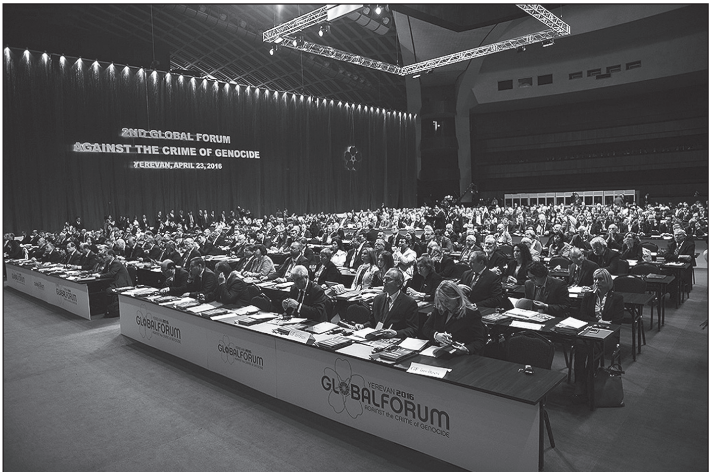
«Ընդդէմ ցեղասպանութեան յանցագործութեան» 2-րդ միջազգային ֆորում (Ապրիլ 2016 - ԵՐԵՒԱՆ)

Հայաստանը 2015, 2016, 2018 եւ 2022 թթ. նախաձեռնել եւ կազմակերպել է նաեւ «Ընդդէմ ցեղասպանութեան յանցագործութեան» միջազգային ֆորումները: