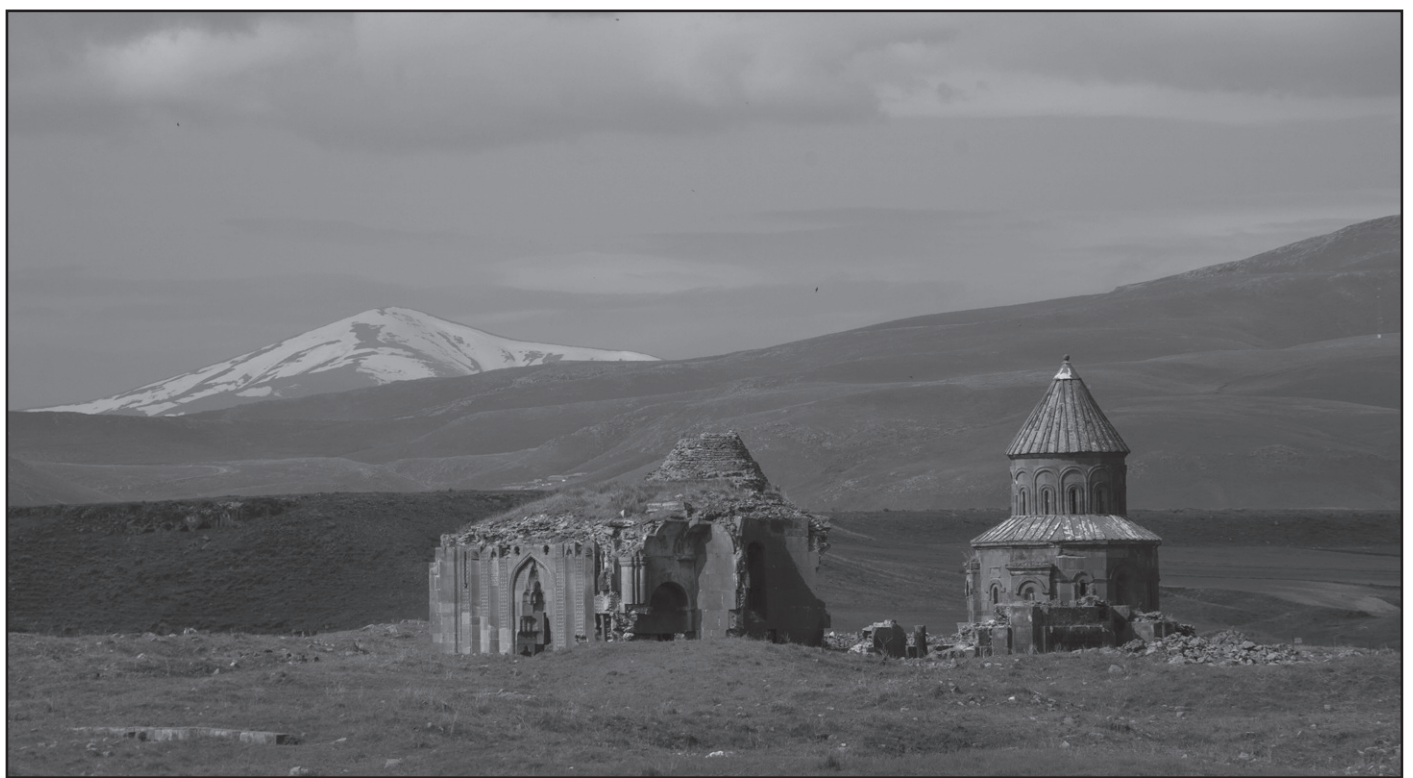
Անիի Սուրբ Առաքելոց եւ Աստուածածնի Սուրբ Գրիգոր եկեղեցիներ