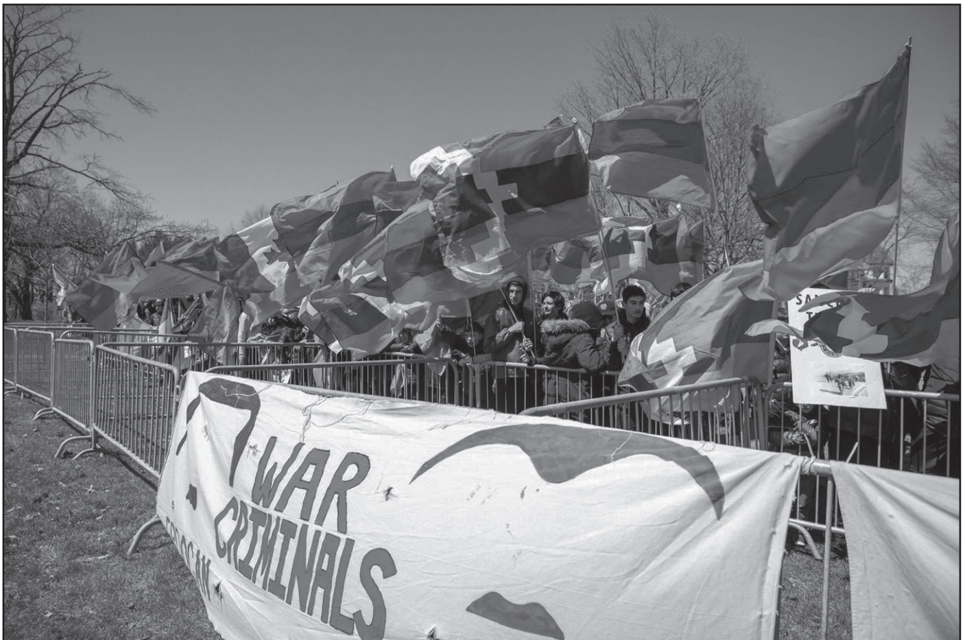
Յուշ՝ Օթթաուսի Թրքական դեսպանատան դիմաց (2025)