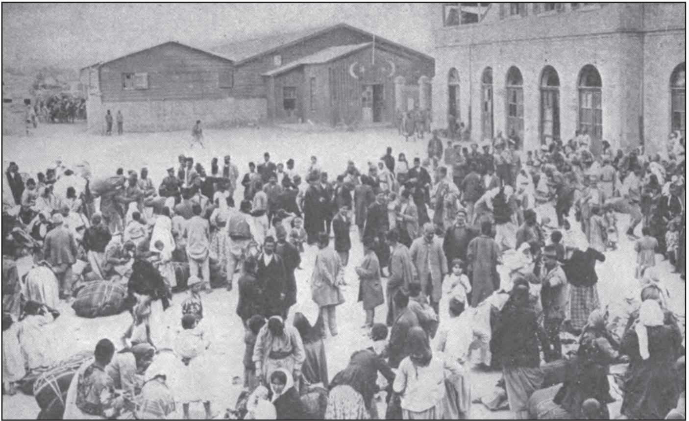
Armenians gathered prior to deportation

criminality. Legal scholarship examining these trials notes that Ottoman prosecutors themselves characterized the deportations and massacres as crimes against humanity and sought to establish culpability through domestic tribunals. This amounted to an implicit acknowledgment that the façade of “lawful deportation” could not obscure or excuse the underlying acts.