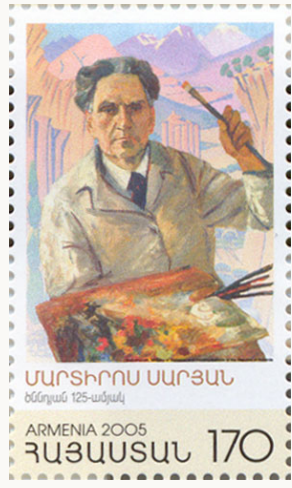
Հայկական դրոշմաթուղթ նուիրուած Մարտիրոս Սարեանի ծննդեան 125-ամեակին