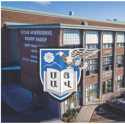
Սուրբ Յակոբ Ազգային վաժարան

Սուրբ Յակոբ Ազգային վաժարանի, Սարաֆեան նախակրթարանի վեցերորդ դասարանի աշակերտները, իրենց հայերէնի ուսուցչուհի՝ տիկին Մարալ Անթապեանի հետ, սերտելէ ետք Մուշեղ Իշխանի «Հայ լեզուն տունն է հայուն» բանաստեղծութիւնը, արտայայտած են իրենց մտքերը, հետեւեալ նիւթով.