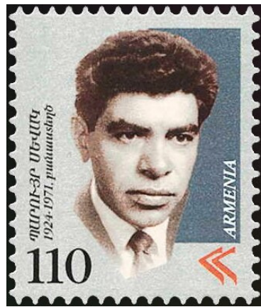
Հայկական դրոշմաթուղթ Պարոյր Սեակի նկարով