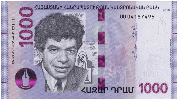
Պարոյր Սեակի նկարը Հայաստանի Հանրապետութեան 1,000-նոց թղթադրամին վրայ

Պարոյր Սեակ զոհուեցաւ 1971 թուականի Յունիս 17-ին, ինքնաշարժի արկածով: