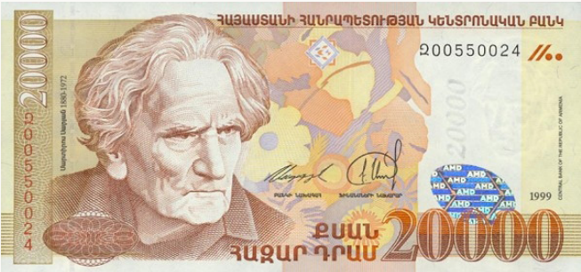
Մարտիրոս Սարեանի նկարը Հայաստանի Հանրապետութեան 20000-նոց թղթադրամին վրայ