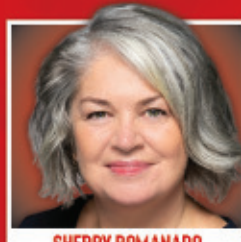
SHERRY ROMANADO DÉPUTÉE / MP Longueuil – Charles-LeMoine Sherry.Romanado@parl.gc.ca (450) 671-1222