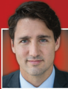
TRÈS HON. JUSTIN TRUDEAU DÉPUTÉ / MP Papineau Justin.Trudeau.c1c@parl.gc.ca (514) 277-6020