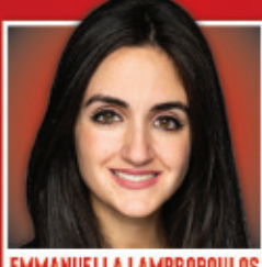
EMMANOUELLA LAMBROPOULOS DÉPUTÉE / MP Saint-Laurent Emmanouella.Lambropoulos@parl.gc.ca (514) 335-6655