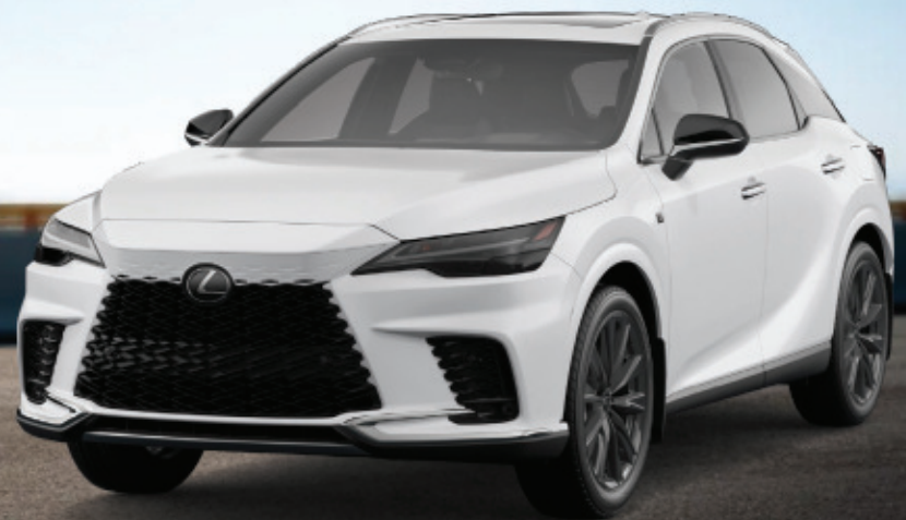
2024 RX 350 AWD F SPORT 1