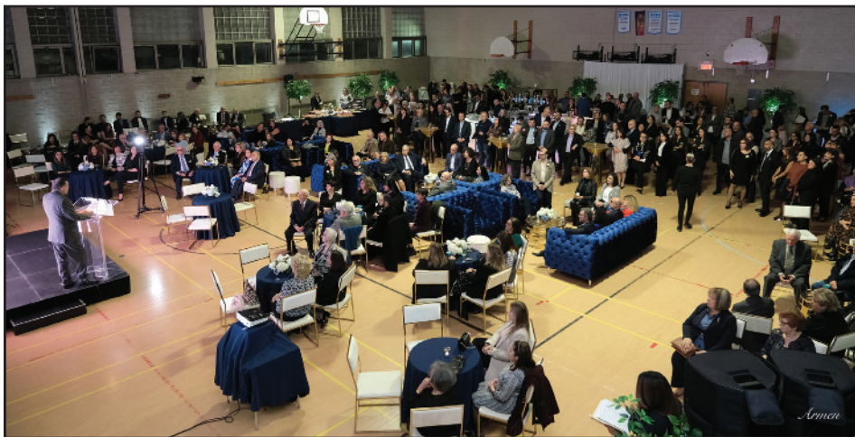
Կարդալ էջ 5