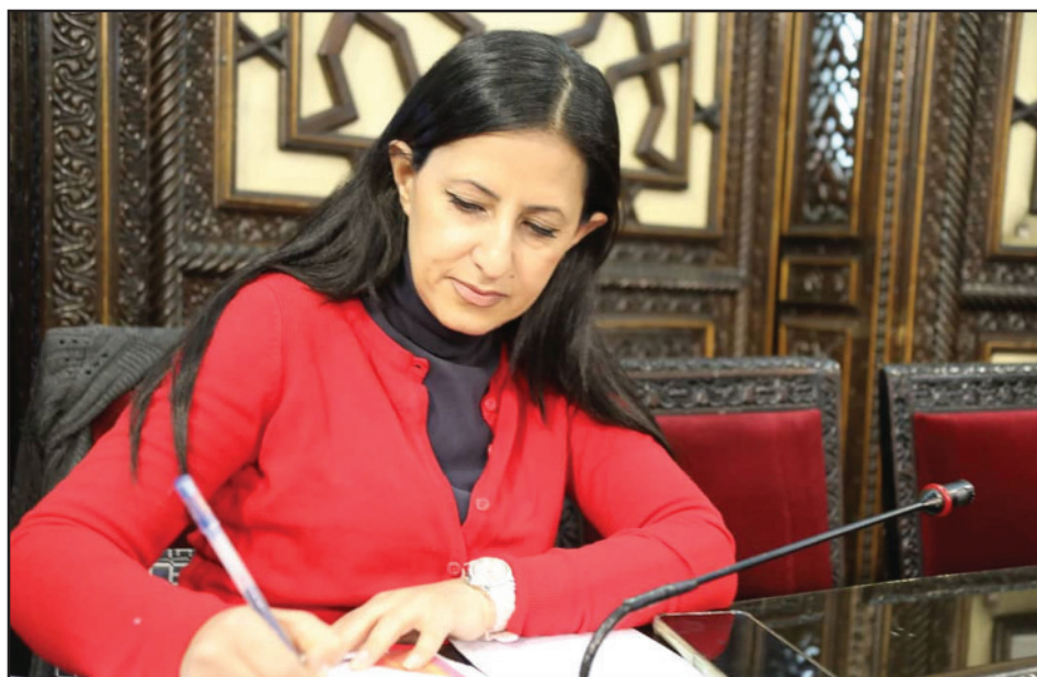
Կարդալ էջ 3