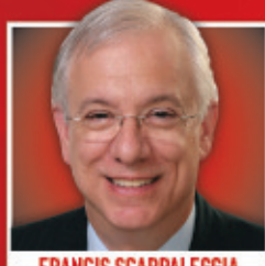
FRANCIS SCARPALEGGIA DÉPUTÉ / MP Lac-Saint-Louis Francis.Scarpaleggia@parl.gc.ca (514) 695-6661