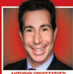
ANTHONY HOUSEFATHER DÉPUTÉ / MP Mont-Royal / Mount Royal AnthonyHousefather@parl.gc.ca (514) 283-0171