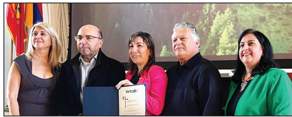
Կարգալ էջ 3