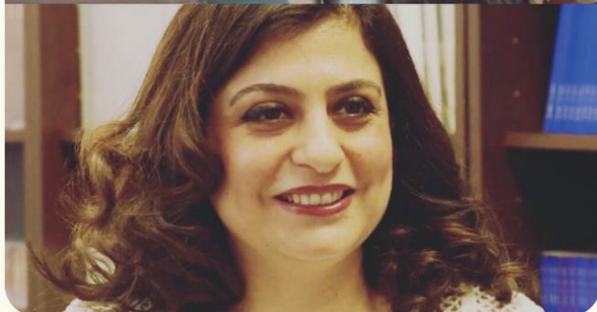
SYRIAN-ARMENIAN REFUGEE COLLECTION