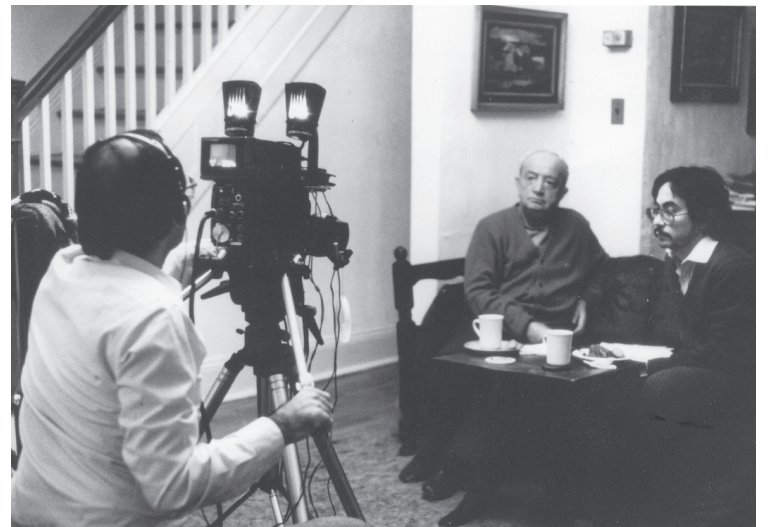
Recording an Interview for Zoryan’s Oral History Collection

From its inception in 1982, the Zoryan Institute realized the importance and urgency of preserving the testimonies of aging Armenian Genocide survivors, who had lived through the horrors of the Genocide during the first world war. The Institute conducted over 800 audio-visual interviews with a trained team of camera operators, scribes, and trained interviewers to create an oral history collection archive. The audio-visual equipment used then was expensive and bulky — a far cry from the portable and affordable cameras of today. Each interview used a questionnaire prepared by specialists from fields including psychology, history, sociology, anthropology. The questions sought to uncover the details of everyday life, prompting interviewees to recount the details of the homes they lived in