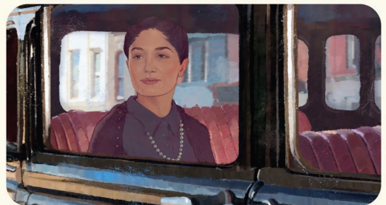
THE ZORYAN INSTITUTE AUA CENTER FOR ORAL HISTORY