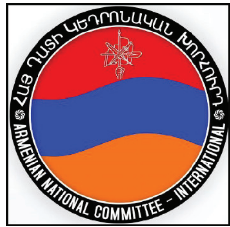
ԵՄ ... Ծար. էջ 4

Եւրոպական խորհրդարանը Հոկտեմբերի 24-ի իր լիազուցումը նիստում ընդունել է «Ատրպէյճանում տիրող իրավիճակի, մարդու իրաւունքների եւ միջազգային իրաւունքի խախտման ու Հայաստանի հետ յարաբերութիւնների մասին» բանաձեւը՝ 453 կողմ, 31 դէմ, 89 ձեռնպահ յարաբերակցութեամբ:Այս