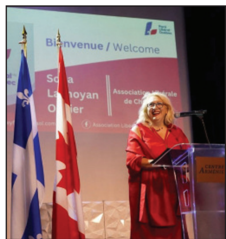
Լախոյեան... Ծար. էջ 7

Միջոցառումը կայացաւ ջերմ եւ տօնական մթնոլորտի մէջ, որուն ներկայ էին համայնքի անդամներ եւ քաղաքական գործիչներ, ինչպէս՝ Քեպէզի Ազատական կուսակցութեան ղեկավար