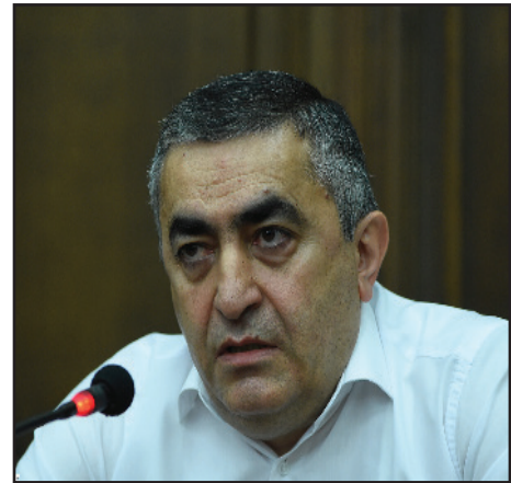
Ռուստամեան... Ծար. էջ 5

«Ամէն ինչ տեղի է ունենում կուլիսների հետեւում, հանրութիւնը միշտ վերջին պահին է իմանում եւ կանգնում