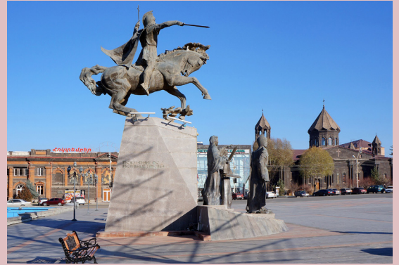
Վարդան Մամիկոնեանի յուշարձանը Գիւմրիի մէջ

Գիւմրին Հայաստանի երկրորդ ամենամեծ քաղաքն է եւ կը գտնուի Շիրակ մարզին մէջ, Երեւանի հիւսիսը: Պատմութեան ընթացքին ան կրած է բազմաթիւ անուններ, որոնց կարգին են «Կումայրի», «Ալեքսանտրապոլ» եւ «Լենինական»: