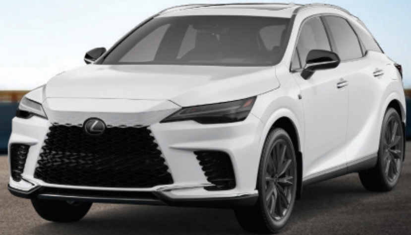
2024 RX 350 AWD F SPORT 1