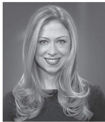
Dr. Chelsea Clinton

YEREVAN—The Aurora Humanitarian Initiative, dedicated to addressing on-the-ground humanitarian challenges around the world, has appointed Chelsea Clinton, vice chair of the Clinton Foundation, to the Selection Committee of the global Aurora Prize for Awakening Humanity. Dr. Clinton is renowned for her efforts to improve lives, inspire emerging leaders around the world, and drive awareness and action around critical issues including health equity.