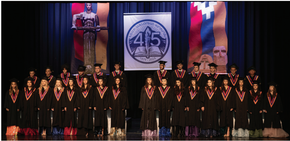
Կարդալ էջ 11