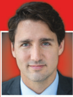
TRÈS HON. JUSTIN TRUDEAU

DÉPUTÉ / MP Papineau Justin.Trudeau.c1c@parl.gc.ca (514) 277-6020