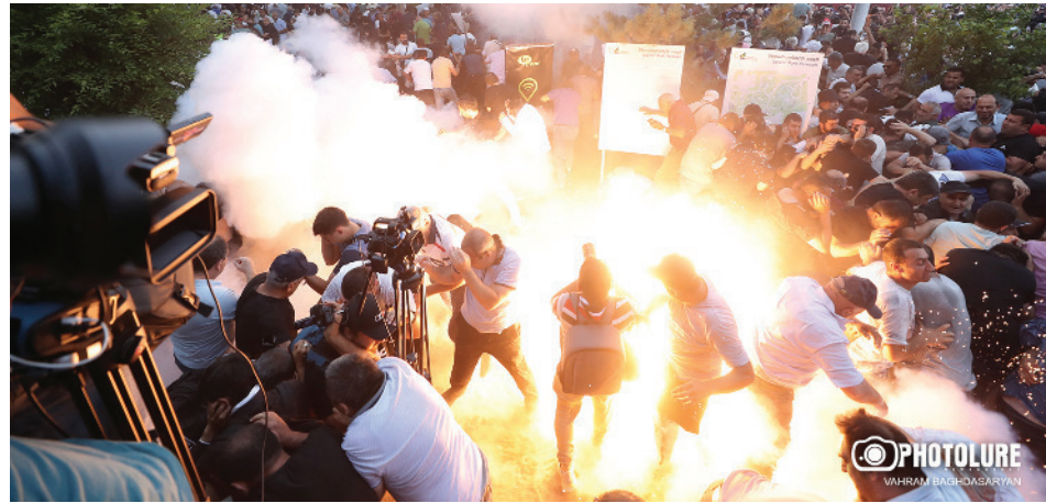
Կարդալ էջ 9