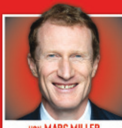
HON. MARC MILLER

DÉPUTÉE / MP Brossard – Saint-Lambert Alexandra.Mendes@parl.gc.ca (450) 466-6872