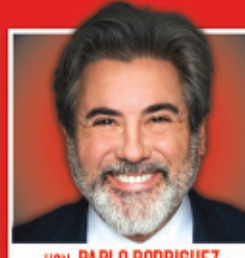
HON. PABLO RODRIGUEZ