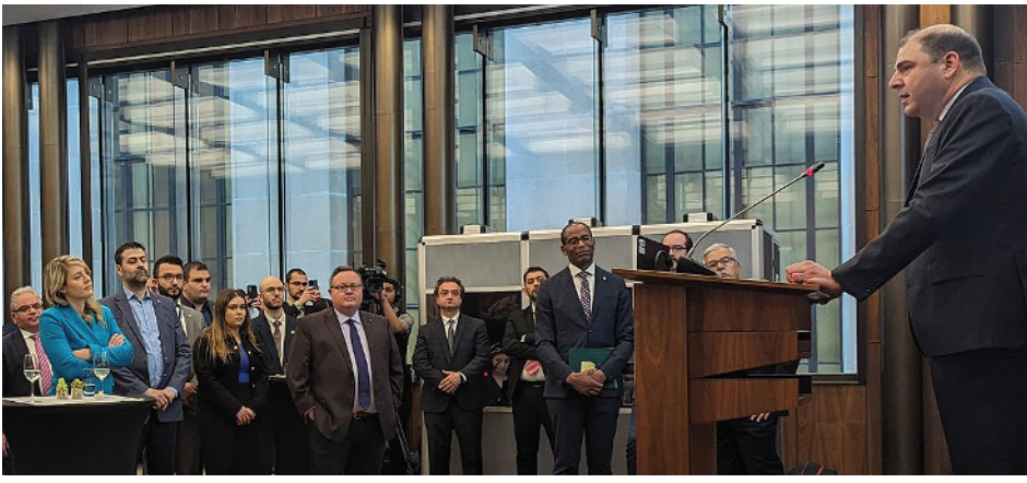
Կարդալ էջ 3