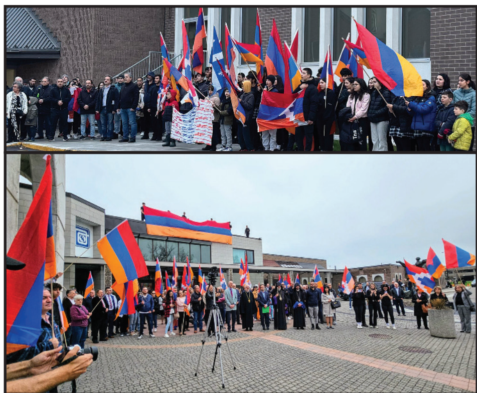
Կարդալ էջ 4