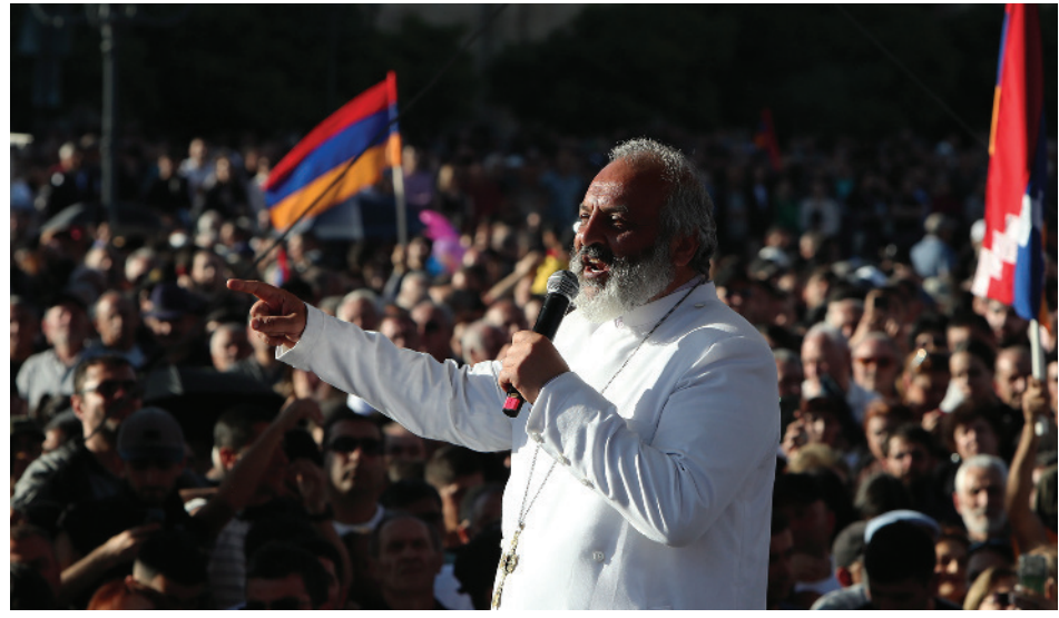
Կարդալ էջ 8