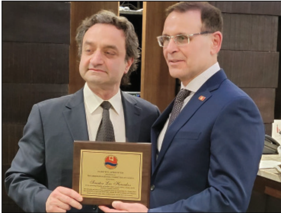
Կարդալ էջ 5