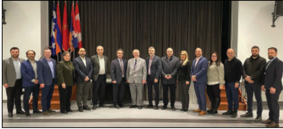
Կարդալ էջ 3