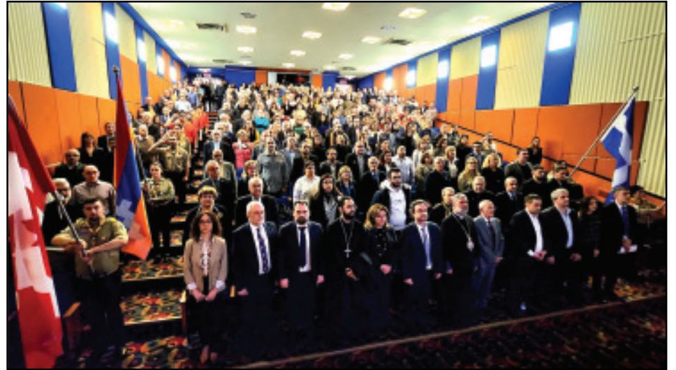
Կարդալ էջ 3