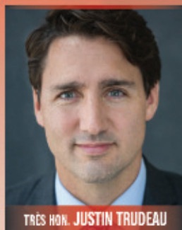
TRÈS HON. JUSTIN TRUDEAU

Député / MP Papineau Justin.Trudeau.c1@parl.gc.ca (514) 277-6020