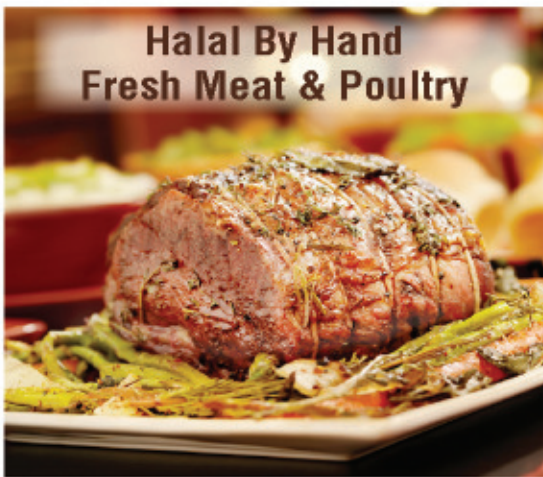
Halal By Hand Fresh Meat & Poultry