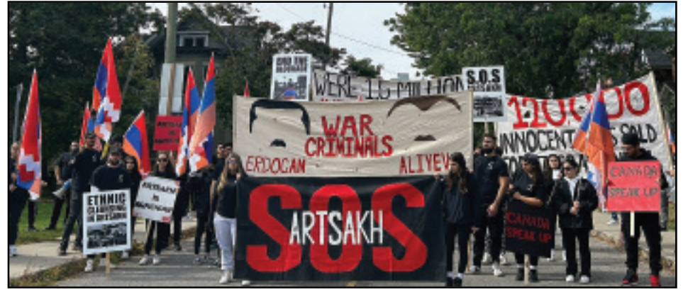
Կարդալ էջ 3