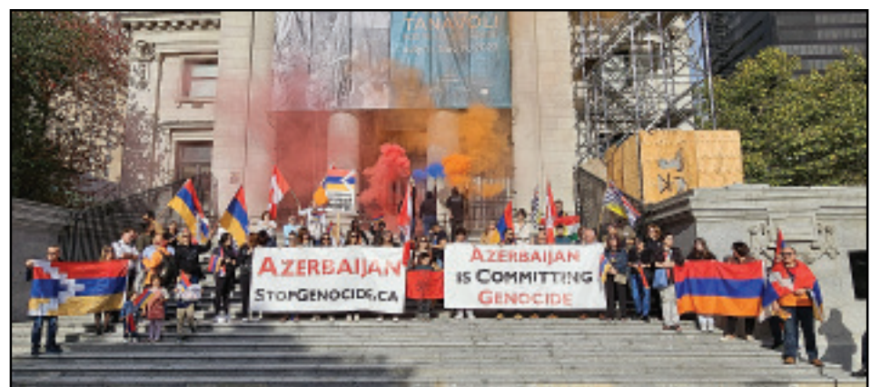
Կարդալ էջ 3