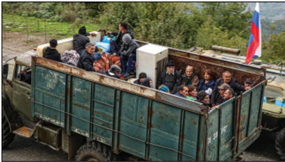
Կարդալ էջ 4

Յունուար 1, 2024-ին Արցախի Հանրապետութիւնը կը դադրի գոյութիւն ունենալ