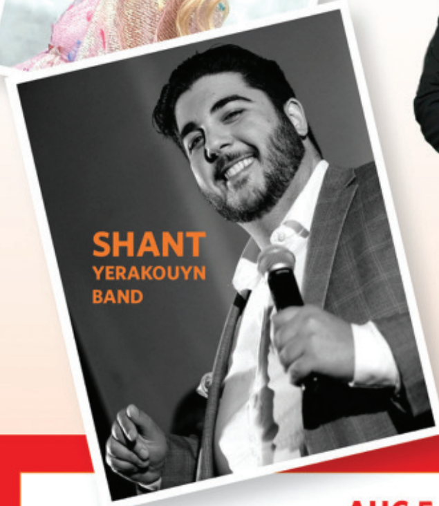
SHANT YERAKOYUN BAND