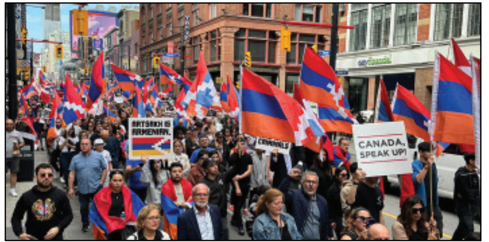
Կարդալ էջ 3