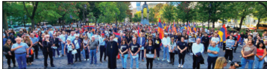
Կարդալ էջ 8