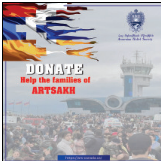
Կարդալ էջ 6