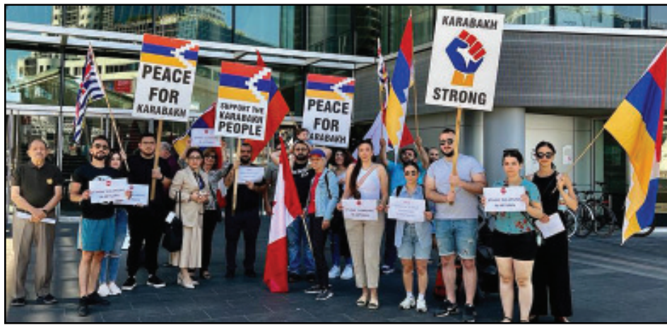
Կարդալ էջ 3