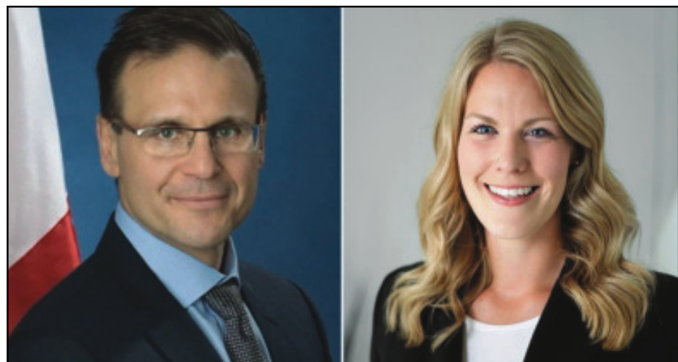
Կարդալ էջ 3