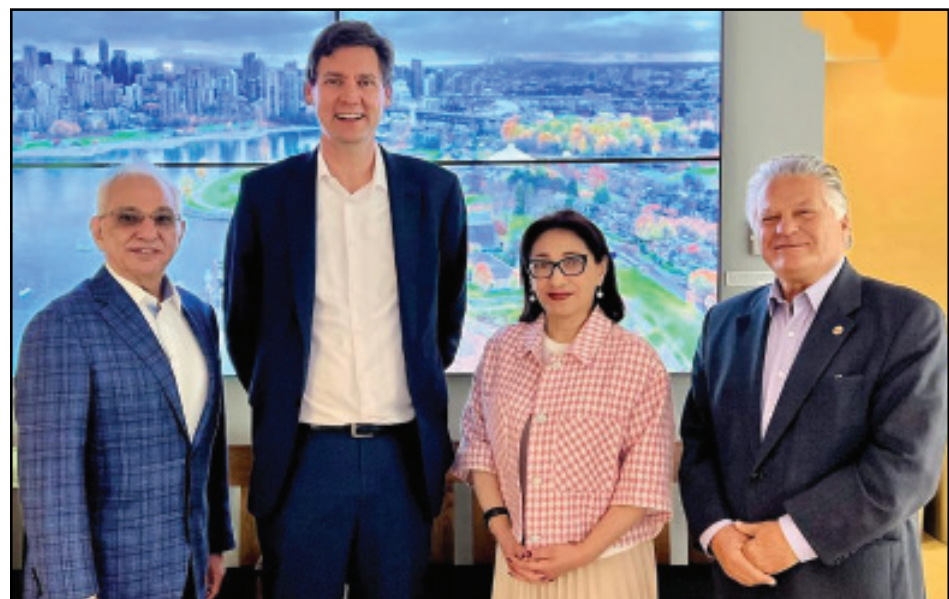
Կարդալ էջ 3