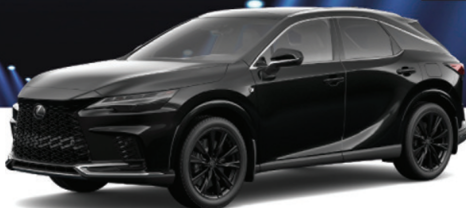
AWD Premium shown