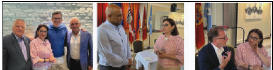
Կարդալ էջ 3