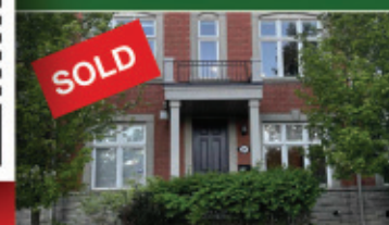
Oakville - $1,229,900