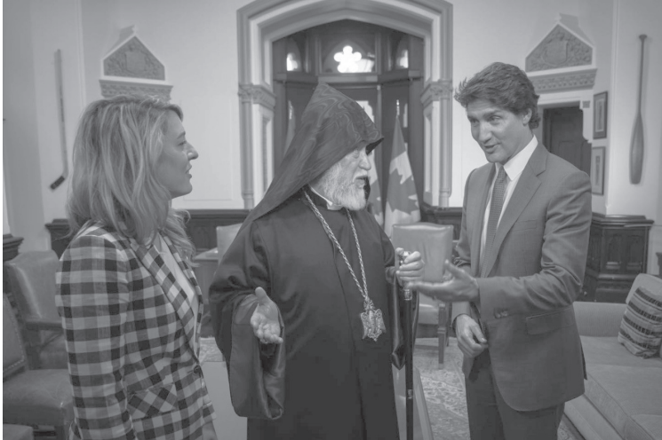
Minister Mélanie Joly, Catholicos Aram I and Prime minister Justin Trudeau