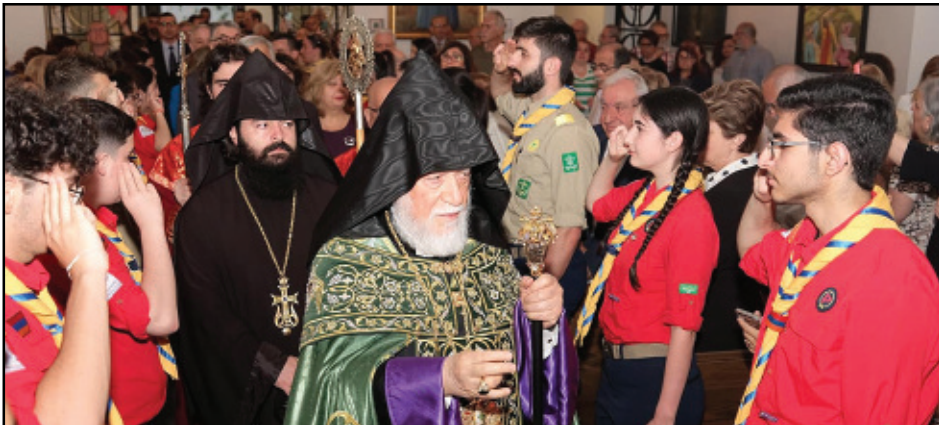
Կարդալ էջ 4