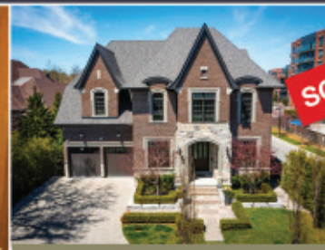
Thornhill - 16 Arnold Ave Custom $4,500,000