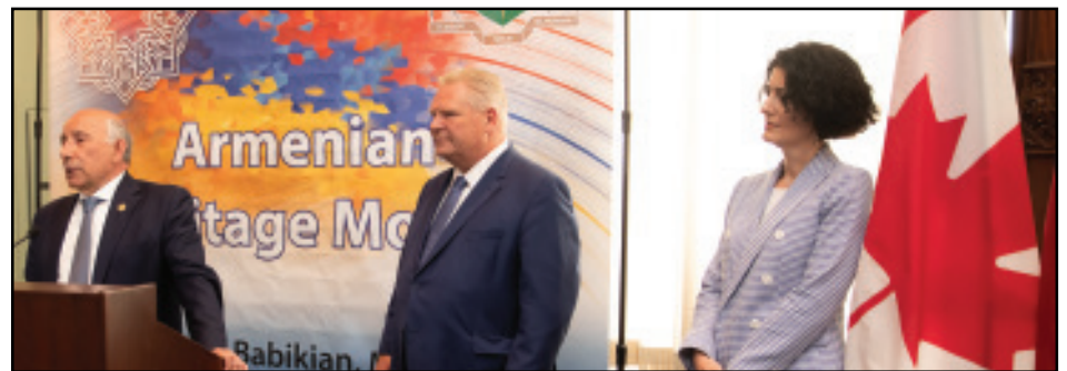
Օնթարիոյի Վարչապետ Տակ Ֆորտի ներկայութեամբ Հայկական Ժառանգութեան ամիսը նշուեցաւ Թորոնթոյի մէջ: Կարդալ էջ 3