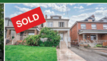
High Park - $1,929,900