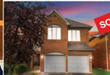
Mississauga 4BR 3Bath - $1,650,000