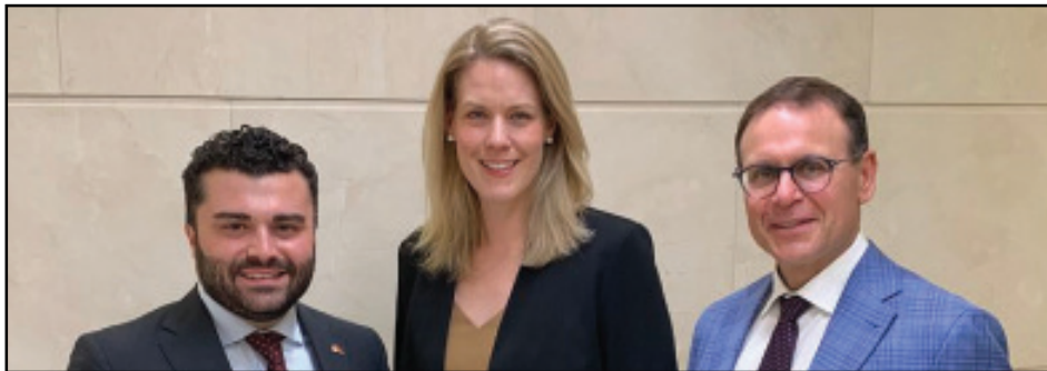
Գանատա-Արցախ խորհրդարանական բարեկամության խմբակցության համանախագահները ընտրուեցան: Կարդալ էջ 3