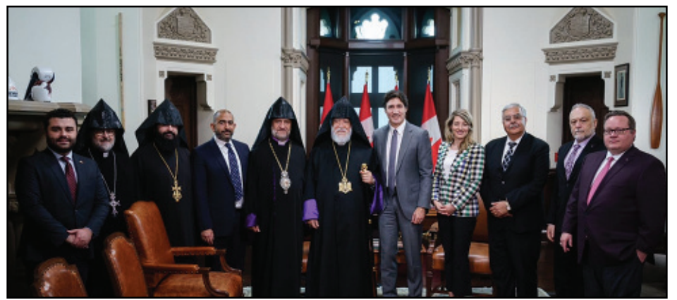
Կարդալ էջ 3