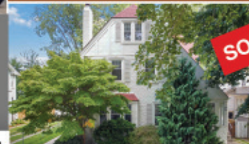
St. Catharines - 5BR 21/2 Storey Tudor $1,199,000