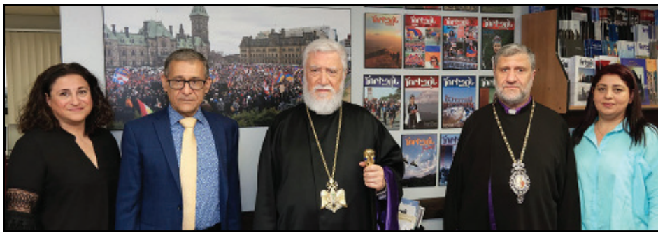
ՆՍՕՏՏ Արամ Ա. Վեհափառ այցելեց «Հորիզոն» խմբագրատուն: Կարդալ էջ 3: