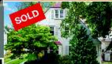
St. Catharines - 5BR 21/2 Storey Tudor $1,199,000