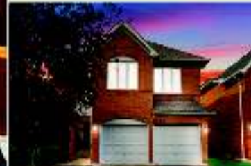
Mississauga 4BR 3Bath - Coming Soon!