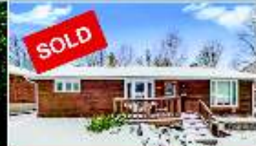
Orangeville - $729,900

Look for it! Coming Soon!! Sr Executive Estate as seen on My past TV commercial $5,500,000