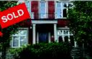
Oakville - $1,229,900