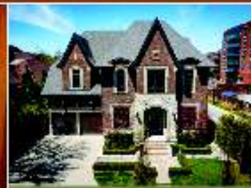
Thornhill - 16 Arnold Ave Custom $4,500,000