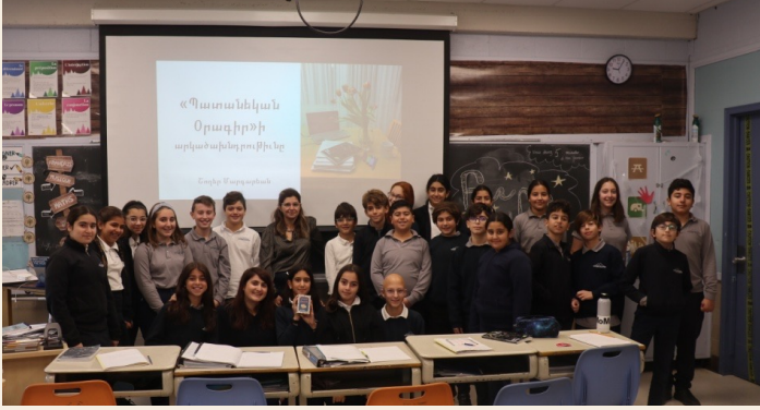
Ս. Յակոբ վարժարանի 2. կարգի աշակերտներու օրագիրէն...