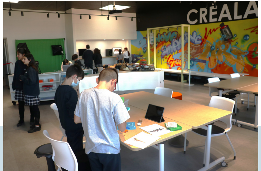
Ս. Յակոբ վարժարանի Զ. կարգի աշակերտներու օրագիրէն...