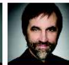
HON. STEVEN GUILBEAULT MP / Député Laurent—Sainte-Marie Steven.Guilbeault@parl.gc.ca 514-523-1359