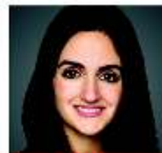
EMMANUELLA LAMBROPOULOS MP / Députée Saint-Laurent Emmanuella.Lambropoulos@parl.gc.ca (514) 335-6655