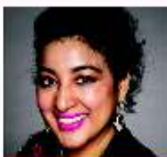
ANJU DHILLON MP / Députée Dorval—Les Brisés—LaSalle Anju.Dhillon@parl.gc.ca (514) 639-4497