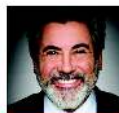
HON. PABLO RODRIGUEZ MP / Député Honoré-Mercier Pablo.Rodriguez@parl.gc.ca (514) 353-5044