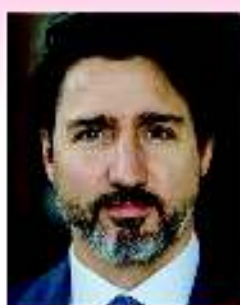
HON. JUSTIN TRUDEAU MP / Député Pequinee Justin.Trudeau@parl.gc.ca (514) 277-6020

In this time of physical distancing, we wish you a safe and enjoyable holiday.