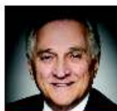
YVES ROBILARD MP / Député Marc-Aurèle-Fortin Yves.Robillard@parl.gc.ca (450) 622-2992