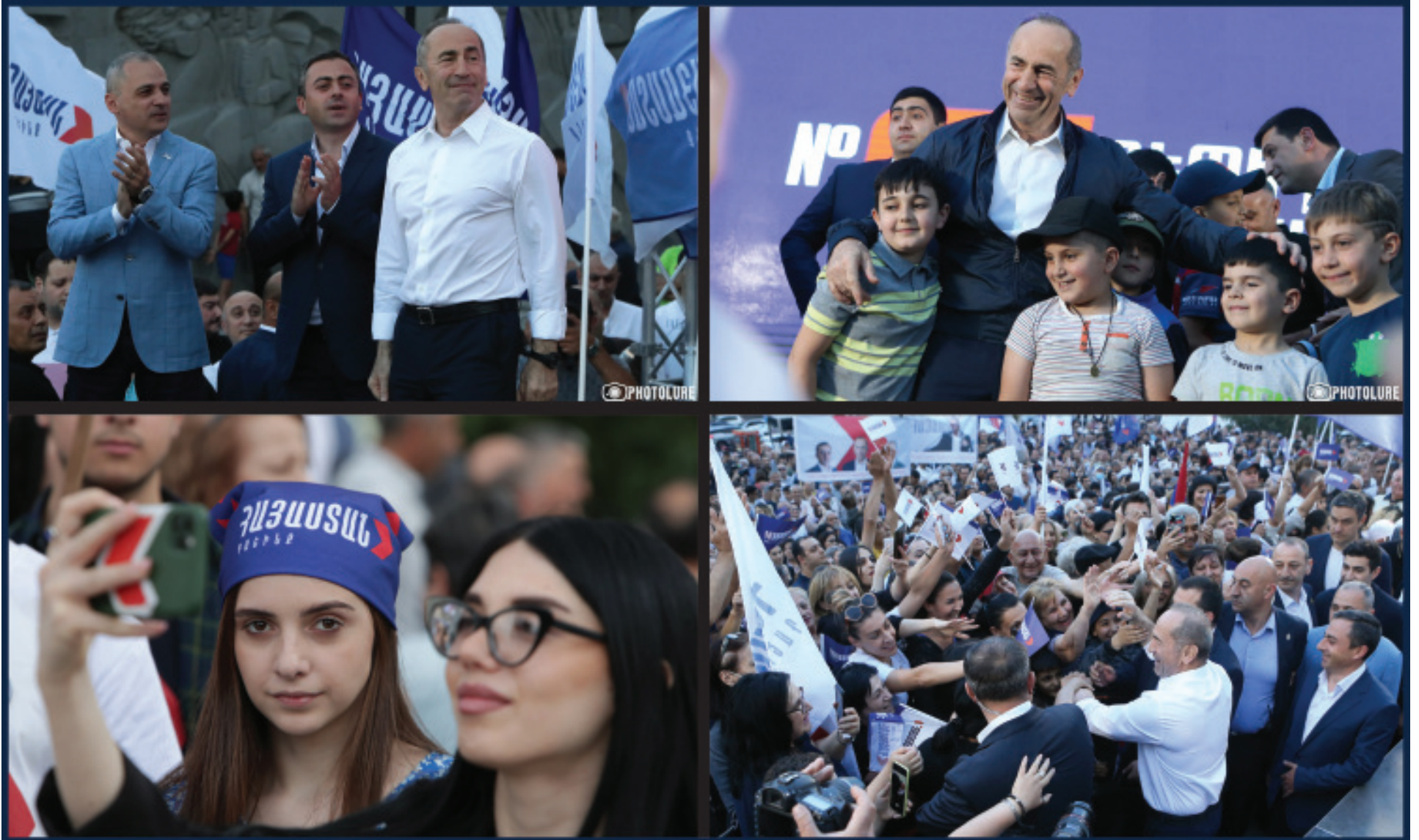
Կարդալ էջ 3