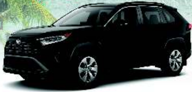
The all-new 2020 RAV4