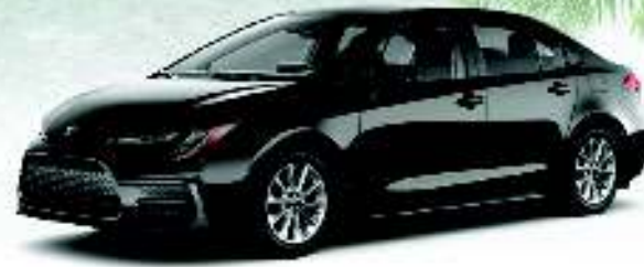
The all-new 2020 COROLLA