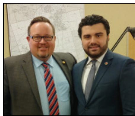
Հանդիպում Գանատա-Հայաստան Խորհրդարանական խմբակցութեան նախագահ Պրայըն Մէյի հետ: Կարդալ էջ 3:

Դիմում ենք ողջախոս հանրութեանն ու քաղաքական ուժերին՝ համախմբուել երկիրն այս կործանարար ընթացքից եւ պահելու օրակարգի շուրջը: ՀՅԴ Հայաստանի Գերագոյն մարմին