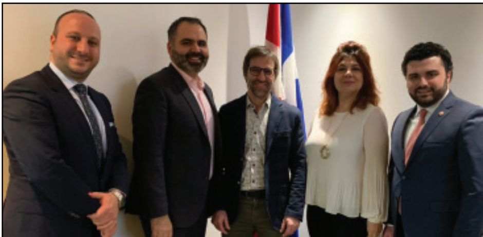
Հայ Դատի Յանձնախումբը Հանդիպեցաւ Գանատայի Ժառանգութեան Նախարար Սթիվըն Կիլպոյի Հետ: Կարդալ էջ 3: