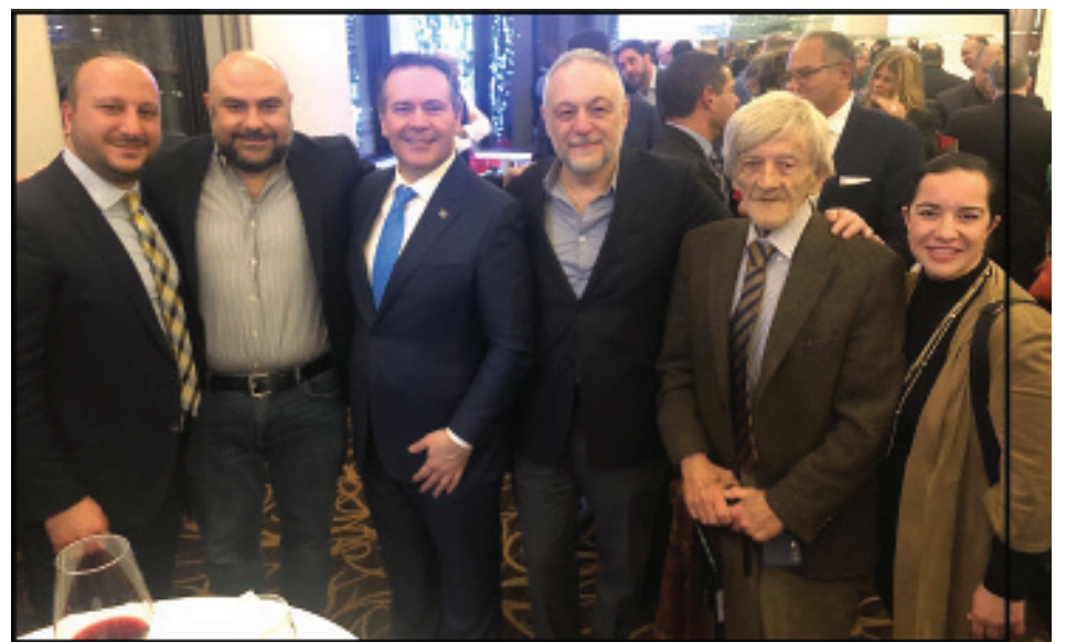
Կարդալ էջ 3: