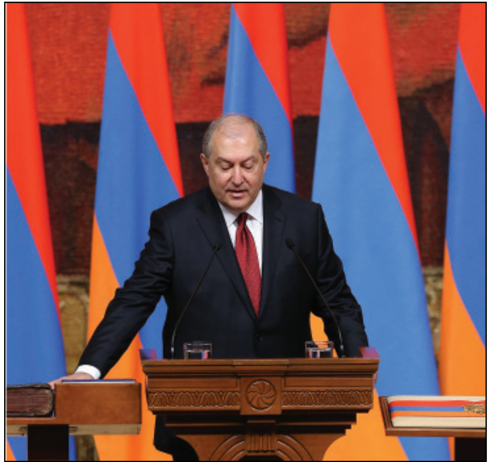
Կարդալ էջ 3