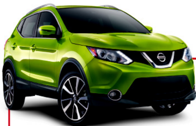
Qashqai SL Platine illustré

UNE ALLOCATION DE 20 000 KM/AN , AVEC KILOMÉTRAGE ADDITIONNEL À 0,10 $/KM