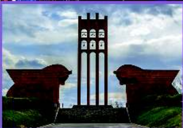
Հայաստանի Հանրապետության 100-ամեակին առիթով

Մասնակցության սակ՝ $4,150 (15 Մարտի 2018-ին Լոս Անջելեսից կը բարձրանայ 10%) Մանրամասնություններու համար հեռաձայնել Առաջնորդարան 514-856-1200 թիվին prelacy@armenianprelacy.ca