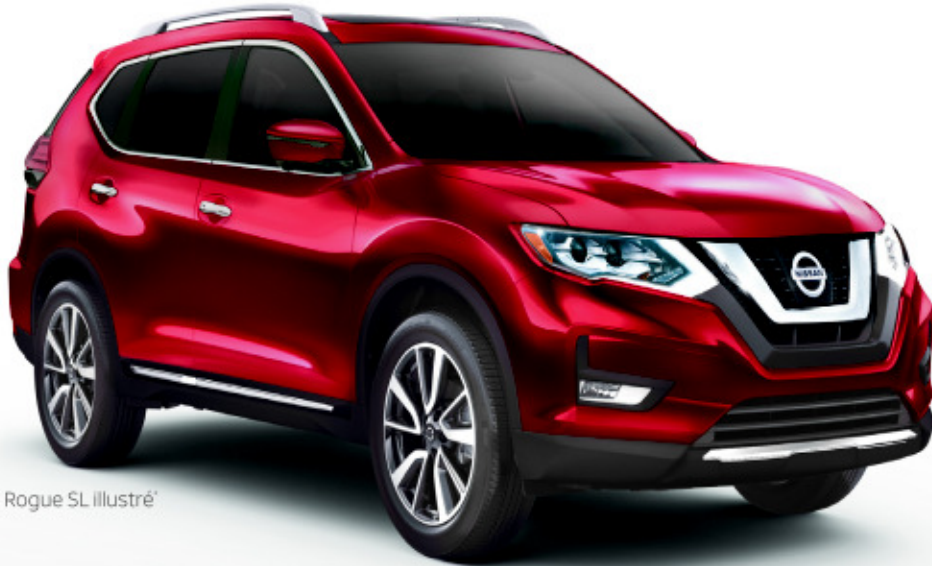
Rogue SL illustré