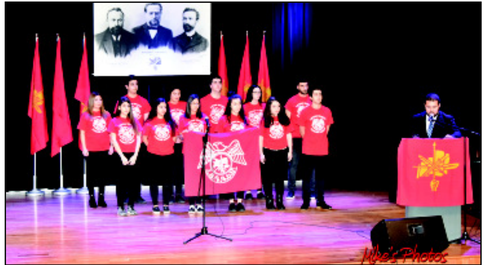
Կարդալ էջ 5