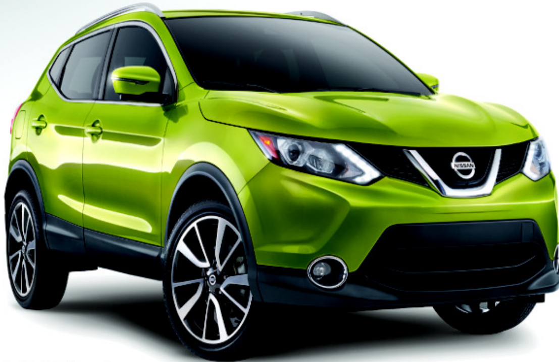
Qashqai SL illustré*

STATIONNEZ-LE COMME UNE AUTO. CHARGEZ-LE COMME UN VUS.