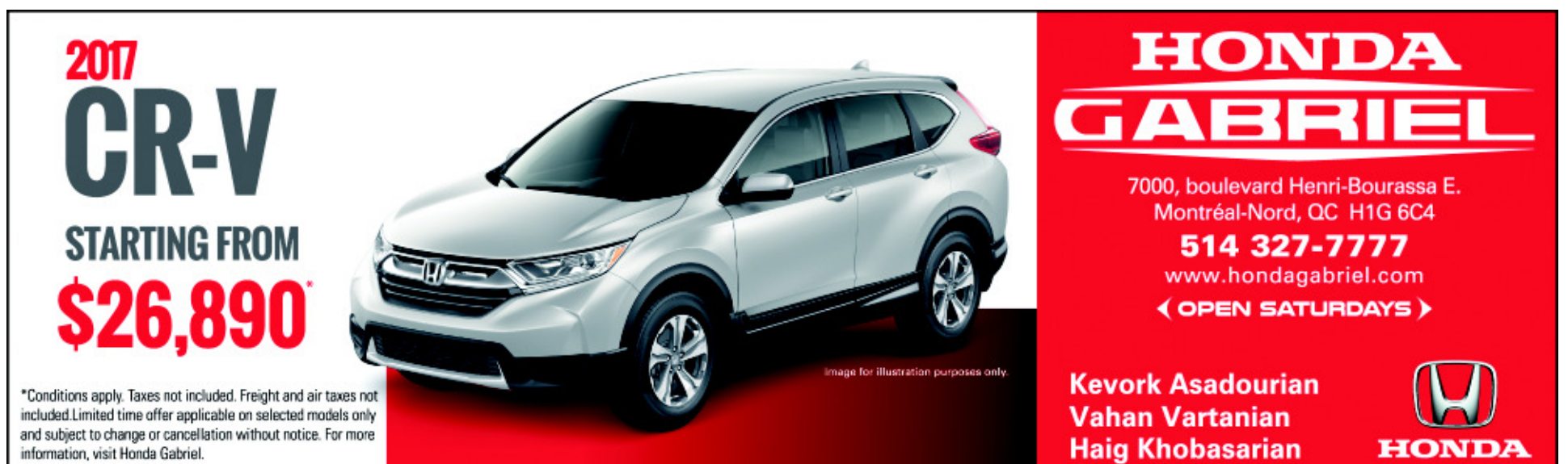
Կարդալ էջ 5

Նոյեմբեր 15-ին, Գանատայի Վանդուվըր քաղաքին մէջ կայացաւ ՄԱԿ-ի խաղաղարարութեան նախարարական համաժողովը, որուն իր մասնակցութիւնը բերաւ Հայաստանի Հանրապետութեան պատուիրակութիւնը՝ Պաշտպանութեան նախարար Վիգէն Սարգսեանի գլխավորութեամբ: Համաժողովին բացումին մասնակցեցաւ նաեւ Գանատայի արեւմտեան շրջանի Հայ դատի յանձնարումքի պատուիրակութիւնը: Մանրամասնութիւնները կարդալ էջ 3: