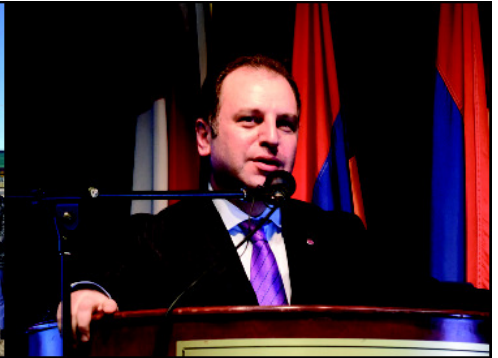
Կարդալ էջ 3