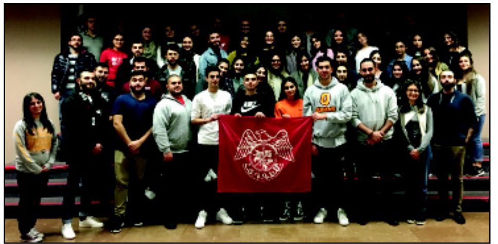
Կարդալ էջ 4