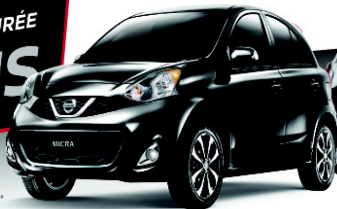
Micra SR illustrée*