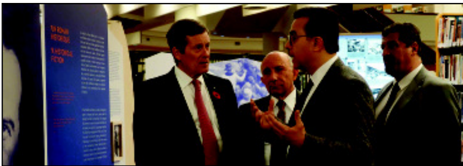
Կարդալ էջ 4