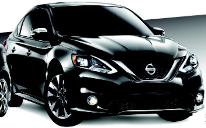
Sentra SR Turbo illustrée*