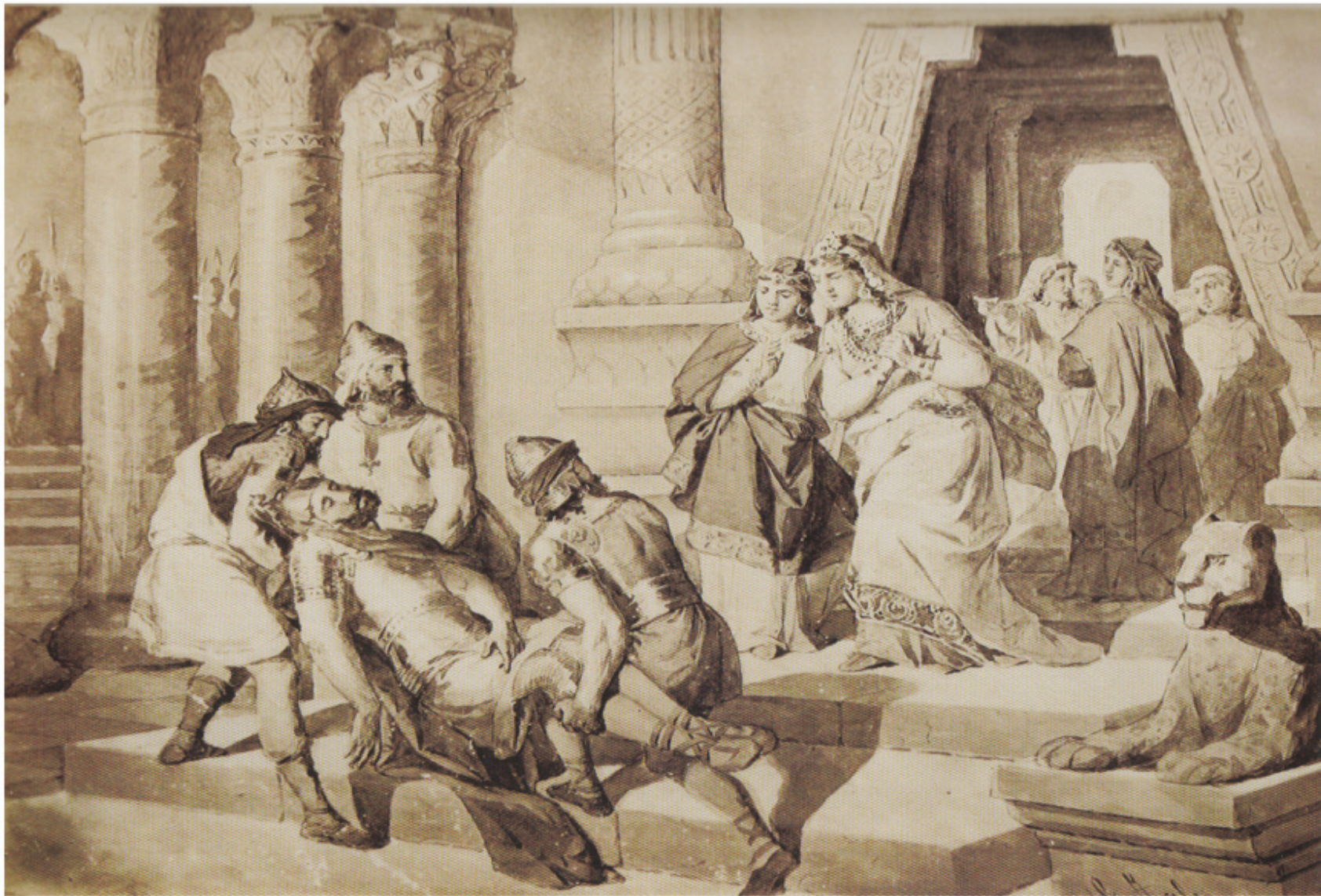
Արա Գեղեցիկ եւ Շամիրամ, «Հայոց պատմութիւնը իտալացի գծագրիչներու նկարչութեամբ»

Արամ Նահապետի որդին՝ Արա, քաջ եւ հայրենասէր նահապետ մըն էր: Ան շատ գեղեցիկ էր: Արա ամուսնացած էր Նուարդ իշխանուհիին հետ: Ասորեստանի Շամիրամ թագուհին կը լսէ Արայի գեղեցկութեան մասին եւ կ'ուզէ ամուսնանալ անոր հետ, սակայն Արա կը մերժէ եւ կ'ըսէ. «Հայոց թագուհին միշտ հայ պէտք է ըլլայ: Ես ո՛չ օտար կին կ'ուզեմ, ո՛չ ալ օտար երկրի հարստութիւն»: Շամիրամ կը զայրանայ ու կը յարձակի Հայաստանի վրայ: Ան իր զինուորներուն կը պատուիրէ, որ ողջ բռնեն Արան, սակայն զինուորները կը սպաննեն Արա Գեղեցիկը: Պատերազմէն ետք Շամիրամ կը հրամայէ, որ Արայի մարմինը դնեն պալատին տանիքը, որպէսզի յարալեզները ողջնցնեն զայն: Արա չ'ողջնար: